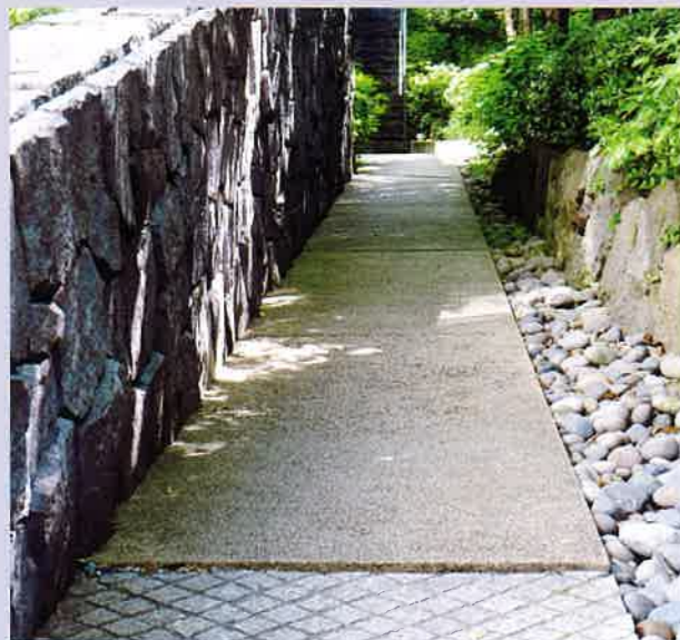
他の仕上材とのコラボレーションや目地レイアウトにより、多様なランドスケープデザインが演出できます。