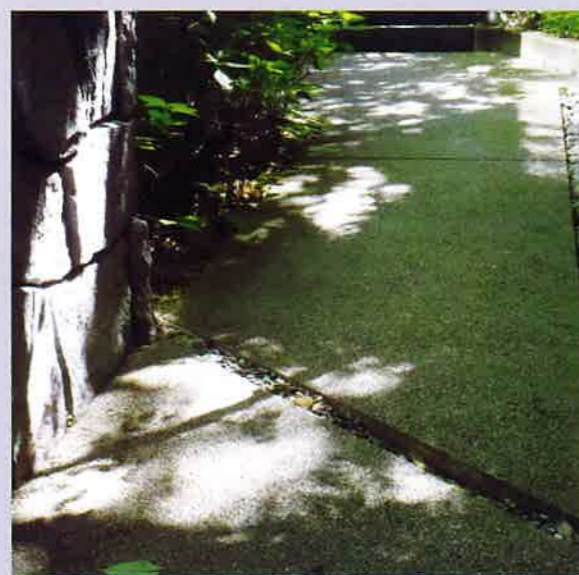
排水性機能を活かした全断面目地のデザイン。